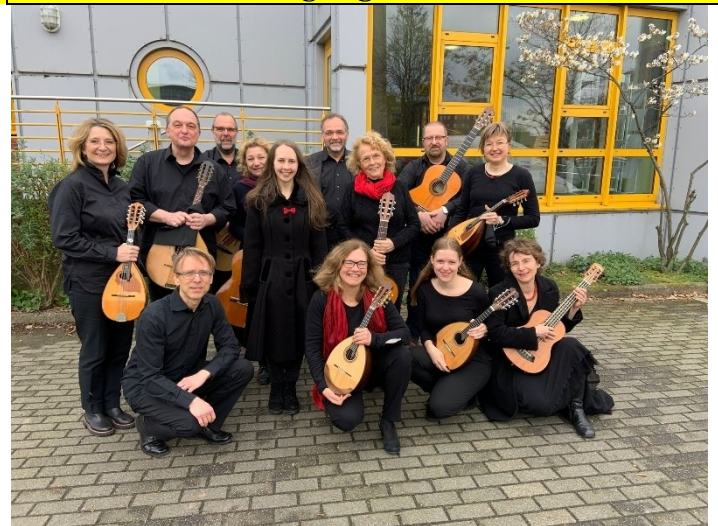
MGO Dortmund e.V.